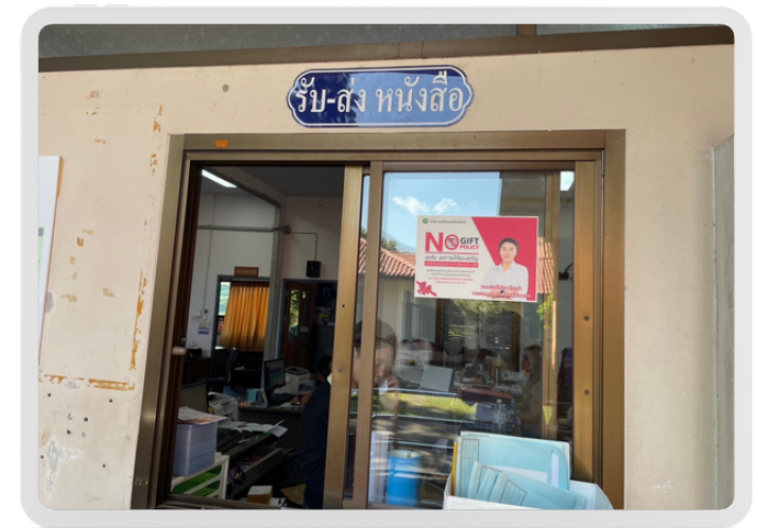
หน้าห้องสำนักปลัดเทศบาล