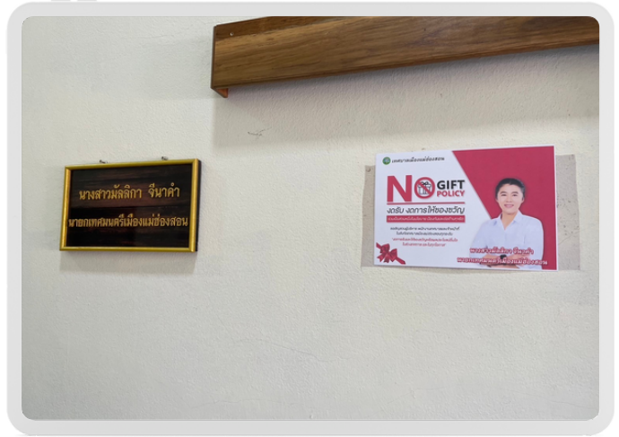
หน้าห้องทำงานนายกเทศมนตรีเมืองแม่ฮ่องสอน