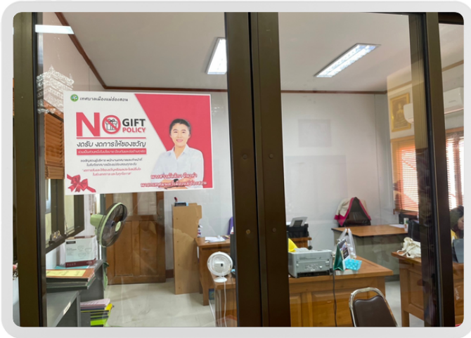
หน้าห้อง นายกเทศมนตรีเมืองแม่ฮ่องสอน