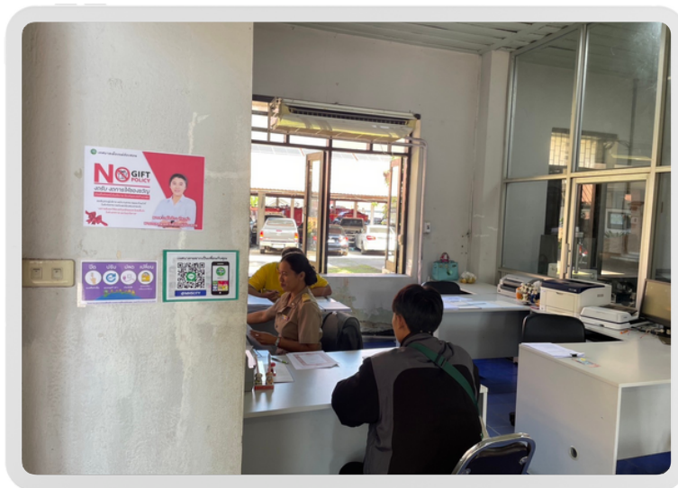
สำนักทะเบียนท้องถิ่น เทศบาลเมืองแม่ฮ่องสอน