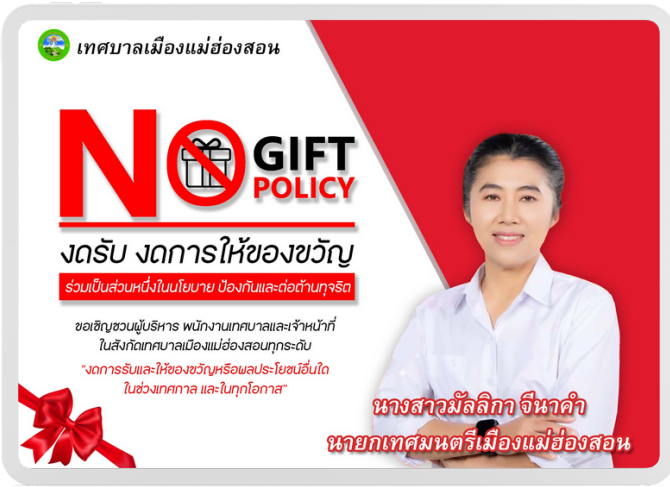
ป้ายประชาสัมพันธ์