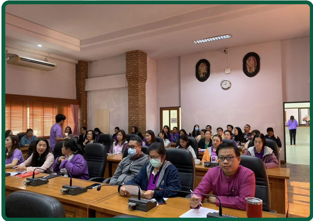
ผู้เข้าร่วมโครงการ บุคลากรเทศบาลเมืองแม่ฮ่องสอน