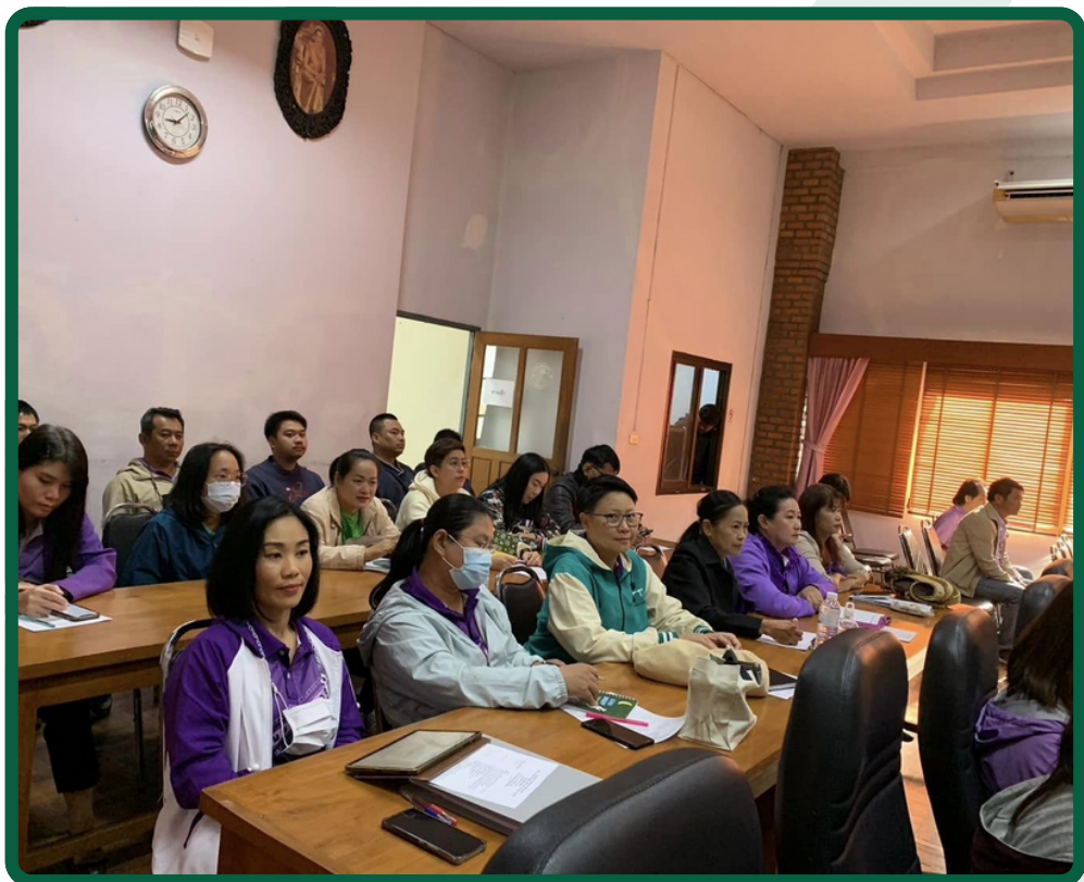
ผู้เข้าร่วมโครงการ ผู้บริหารสถานศึกษาและคณะครูโรงเรียนเทศบาลเมืองแม่ฮ่องสอน