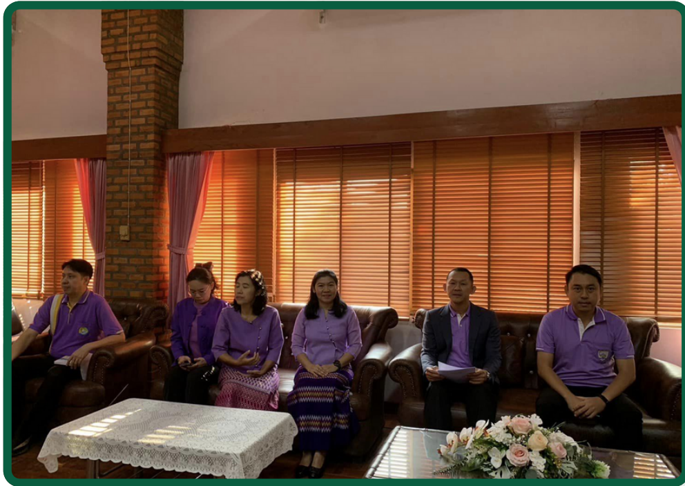
นายกเทศมนตรีเมืองแม่ฮ่องสอน พร้อมด้วยคณะผู้บริหารฯ และวิทยากร