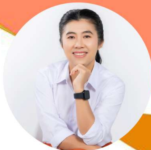
นางสาวมลลิกา จินาคำ นายกเทศมนตรีเมืองแม่ฮ่องสอน

เทศบาลเมืองแม่ฮ่องสอนเป็นหนึ่งในหน่วยงานองค์กรปกครองส่วนท้องถิ่นภายใต้การกำกับของกระทรวงมหาดไทย ซึ่งมีเป้าหมายหลักที่ยึดถือปฏิบัติมาโดยตลอดคือ บำบัดทุกข์ บำรุงสุข ภายใต้บทบาทหน้าที่การให้บริการสาธารณะให้แก่ประชาชน